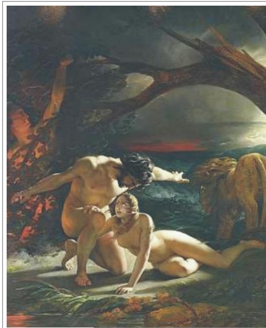
Edouard Louis Dubufe: Adam a Eva